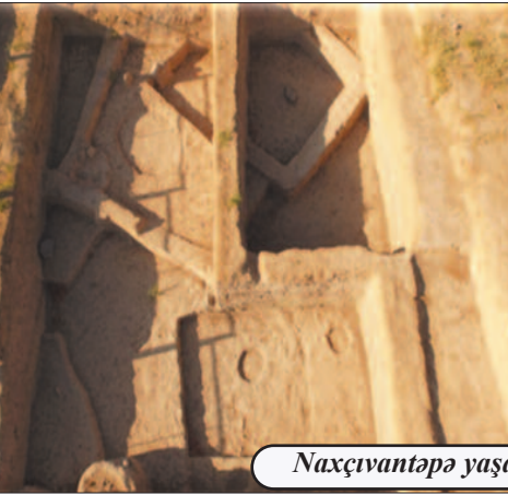
Naxçıvantəpə yaşayış yeri

Kültəpə ətrafında məskunlaşan qədim insanlar Zəngəzur və Dərələyəz dağlarındakı faydalı qazıntılardan yararlandığını Göyçə və Urmiya hövzələri, Mil və Qarabağ düzlərinin daxil olduğu böyük coğrafi məkanda yaşayan insanlar arasında iqtisadi və mədəni əlaqələrin olduğunu deməyə əsas verir. Yaşayış ye-