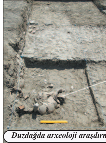
Duzdağda arxeoloji araşdırmalar