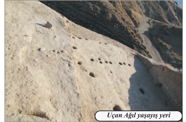
Uçan Ağıl yaşayış yeri

da aşkar edilmişdi. Ümumiyyətlə, Sirab ətrafındakı abidələrdə mədəni təbəqənin az yığılması, mis filizi qalıqlarının tez-tez tapılması, insanların mövsümi həyat tərzini keçirdiyini, mədənciliyin onların həyatında mühüm yer tutduğunu göstərir. Uçan Ağıldan aşkar olunan bəzi keramika parçalarında I Kültəpə üçün xarakterik olan texnoloji xüsusiyyətlərin izlənməsi Eneolit mədəniyyətinin Son Neolit mədəniyyəti əsasında inkişaf etdiyini göstərir.